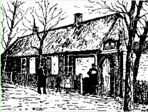
Het gemeentehuis van 1844 tot 1885, waarin thans een sigarenwinkel is gevestigd.

"Een gemeentehuis is daarom nog iets geheel anders dan een ander huis in de gemeente en het is dan ook van betekenis dat het staat in het centrum van die gemeente."