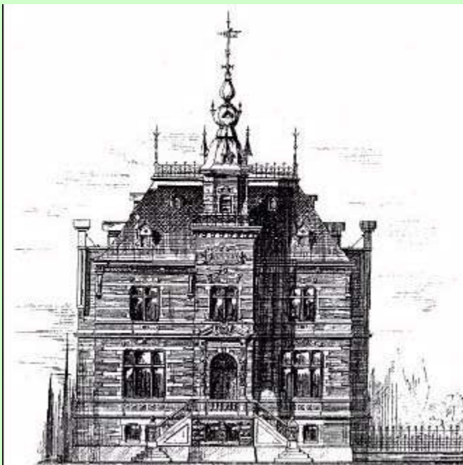
Voorgevel van het mooiste raadhuis ter wereld